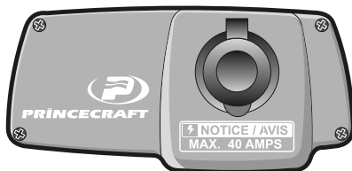
FIGURE 4-2 FICHE DE STYLE ECONO — 12 VOLTS