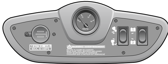
FIGURE 4-4 LA PRISE 12/24 VOLTS DU MOTEUR ÉLECTRIQUE