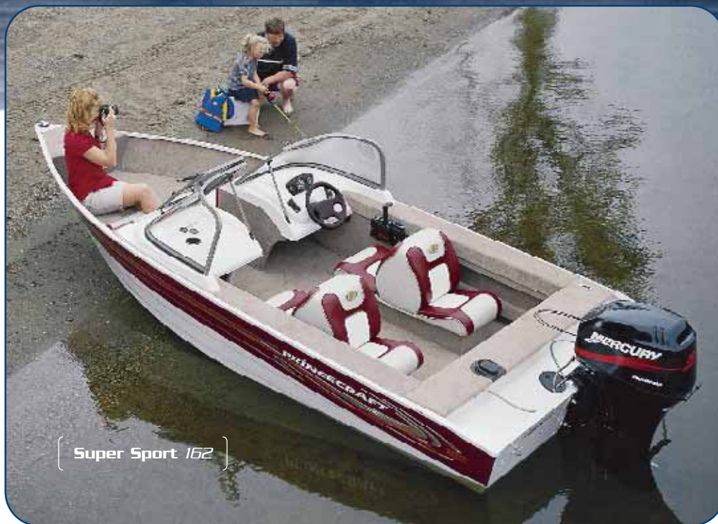
Super Sport 162

Option Cette échelle d'embarquement repliable est une option très appréciée des baigneurs et des skieurs.